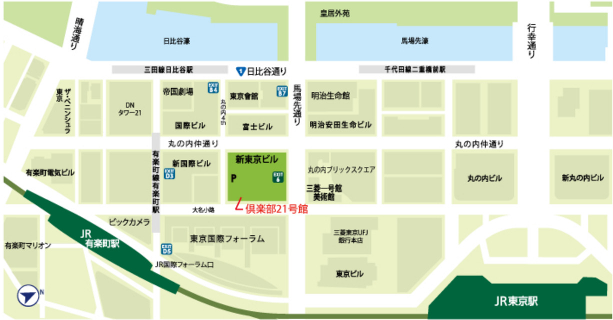
新東京ビル館内図