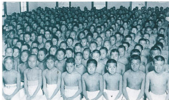
裸体凝念（成蹊中学校・大正 5 年）