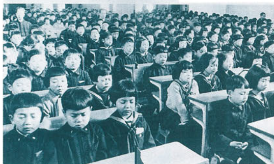
昭和 21 年当時の凝念の様子 （アサヒグラフ第 45 巻 15 号掲載）