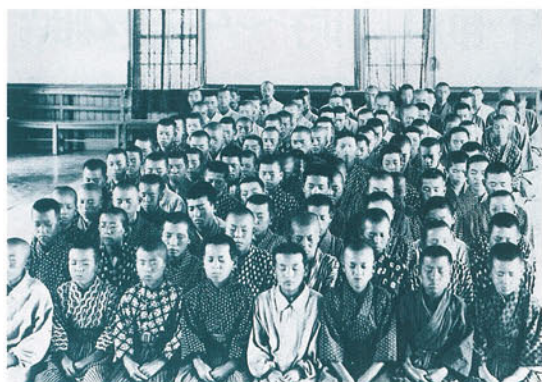
成蹊実務学校生徒の 凝念（大正 8 年）