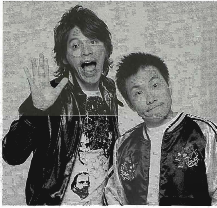
第2回M-1チャンピオン「ますだおかだ」

今年も、3年ぶりにお笑いライブが博祭に帰ってきた！成蹊大お笑いライブは、24日に4号館にて行われる。午前11時半開場、開演は午後12時から。